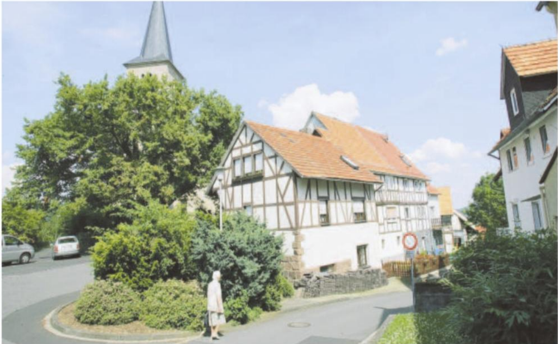
Ländliche Idylle: In Schauenburg – hier eine Szene aus dem Ortsteil Hoof – machen sich die Älteren viele Gedanken über ihr gemeinschaftliches Älterwerden.