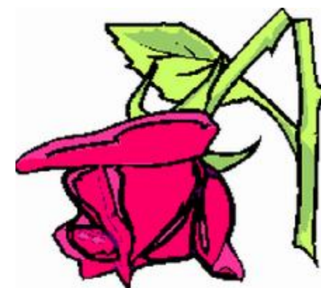
Broken rose – symbol of the Alzheimer Society Bulgaria

Cooperation with the Lord Mayor of Kazanlak, the Alzheimer Society and four homes for the aged in „the valley of the roses“