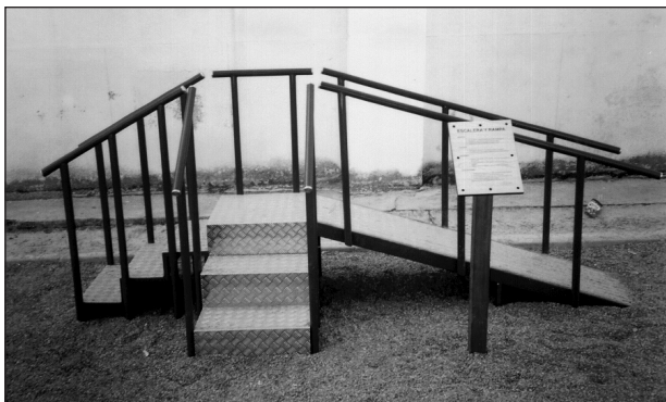
Fig. 6. Escaleras y rampa.