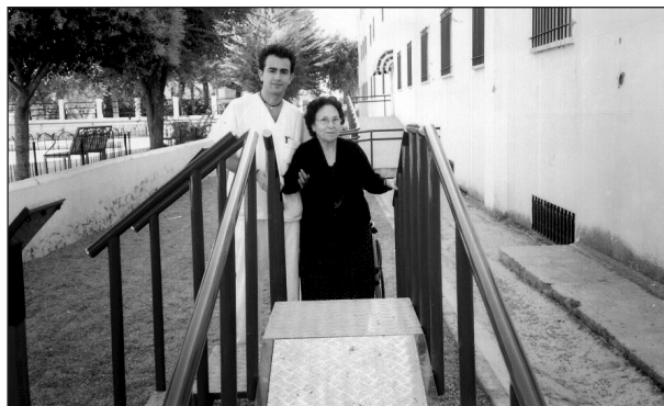
Fig. 7. Escaleras y rampa con barras asideras en todo su recorrido.