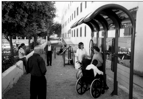
Fig. 10. Panel de tratamiento de los miembros superiores.