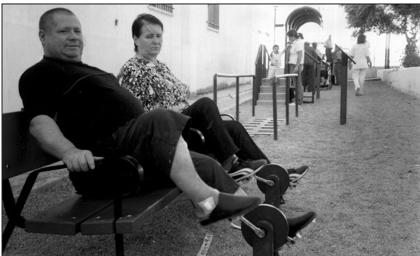
Fig. 3. Banco con pedaliers ajustado a la altura de las personas mayores.