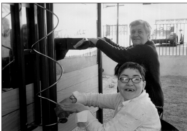
Fig. 12. Muelle para girar la muñeca: mango de madera que recorre el circuito de alambre.