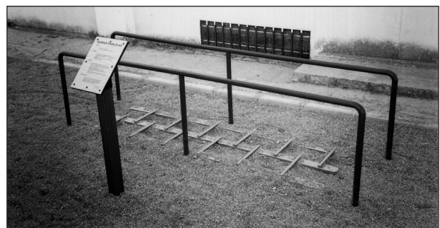
Fig. 4. Barras paralelas.