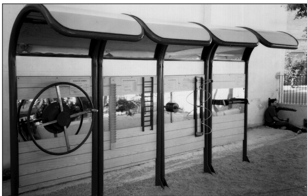
Fig. 9. Panel con rueda de hombro, escalera de dedos, rodillo y placa giratoria y muelle para girar la muñeca.