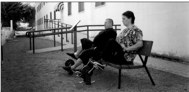
Fig. 2. Banco con pedaliers válido para dos personas.