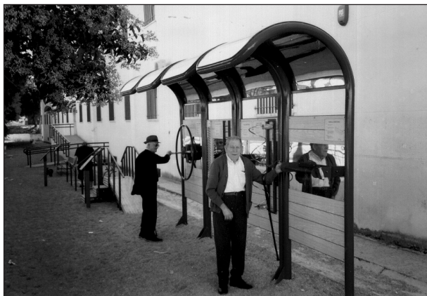
Fig. 11. Rodillo giratorio de uso frontal y lateral por ambos lados.