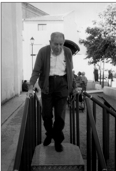
Fig. 8. Escaleras y rampa: suelo metálico antideslizante.